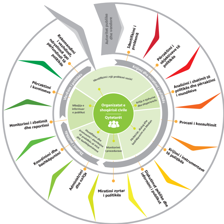
Figura 1. Procesi i politikave publike